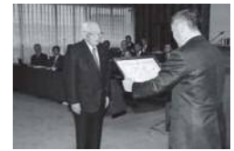
△土岐市功労章授与式