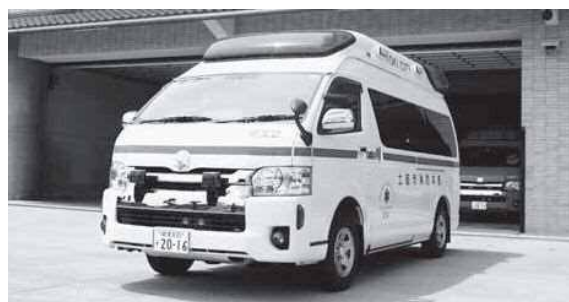
△高規格救急自動車

討論 共謀罪は憲法思想、信条の自由、プライバシーの権利を侵し、過去の治安維持法と比較され、過去の過ちを繰り返さないという気持ちを市民の皆さんは持っているため、採択としたい。