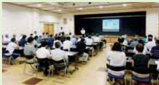
△昨年の議会報告会

今年度も議会報告会を開催します、市民の皆様の率直な意見が聞ける貴重な場として、議員一同、より多くの皆様のご参加を心よりお待ちしております。