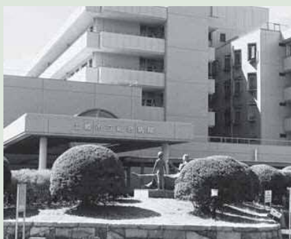
△土岐市立総合病院

答単年度の赤字、黒字、繰入額は大事ですが、肝心な経常的にどう医師を確保するかで、今の総合病院では難しい部分があり、持続可能な病院をどう作っていくかだと思います。