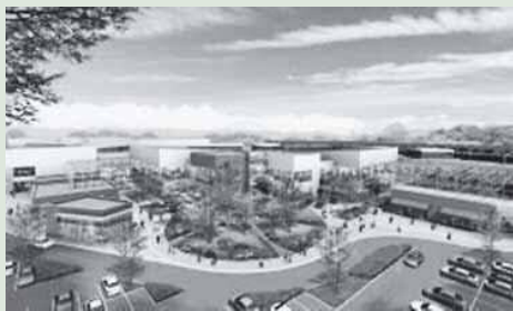
△（仮称）イオンモール土岐イメージ

答 現在は、画一的なものではなく、 地域の特徴を生かした施設・景観づ くりを考えていて、この地域の大き な特色の一つとして美濃焼があるこ とは承知されていて、土岐店におい てはこうした特色、地域らしさを生 かして、その考えに沿って計画され ることを期待している。