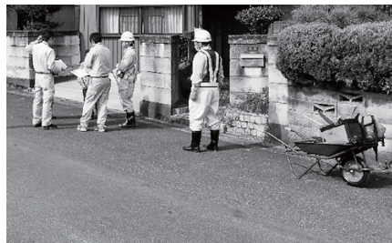
△地籍調査のようす