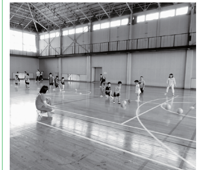
△スポーツセンター(アリーナ)

答弁 アリーナの使用料でアマチュアスポーツ以外に使用する場合で1.36倍の区分があるが、平均では1.18倍である。