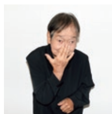
開いた手の中指で鼻を押す