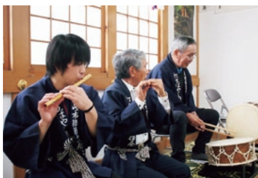
▲土岐打囃子保存会 演奏の様子

1年生と2年生は、半年間の学習の後、学校の発表会「中馬会」で、それぞれ踊りと演奏を披露します。昨年11月18日に行われた中馬会では、2年生18人が打囃子の曲の中から「岡崎笛」を演奏しました。4月に練習を始めた時は、音を出すことも難しかったという篠笛、曲のリズムを決める太鼓、それぞれの音色が合わさり、見事な演奏でした。