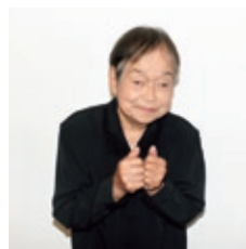
両手を握り震える様子