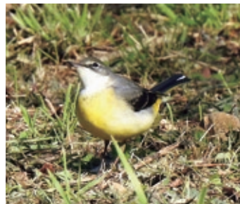
キセキレイ チチン、チチン♪

鳴き声から野鳥を想像し観察するバードウォッチングは、冬の陶史の森の楽しみ方の一つです。