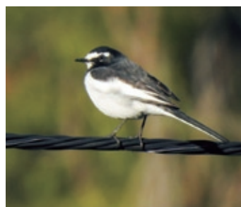
セグロセキレイ ジュジュ♪