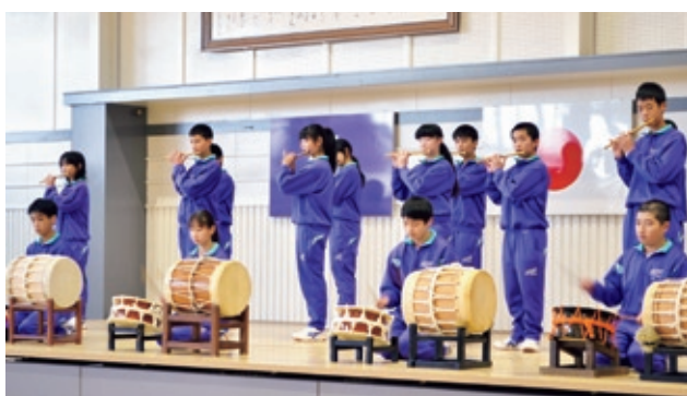
▲2年生による打囃子の発表 （濃南中学校「中馬会」にて 11月18日撮影）