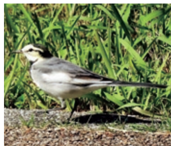
ハクセキレイ チュチュン♪