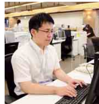
定期的な健診を呼び掛ける市民課保険年金係の担当者

*土岐健診だよりは、このコーナーのために編集したもので、定期発行するものではありません