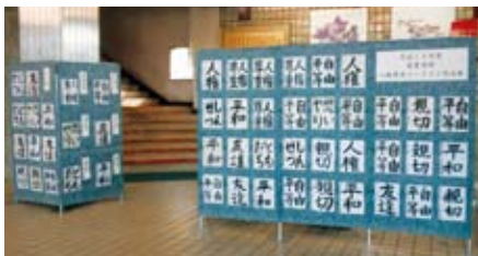
※写真は過去のものです。