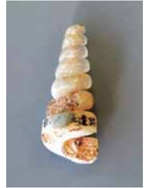
ビカリエラの化石