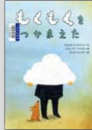
もくもくをつかまえた ミカエル・エスコフィエ／文 クリス・ディ・ジャコモ／絵