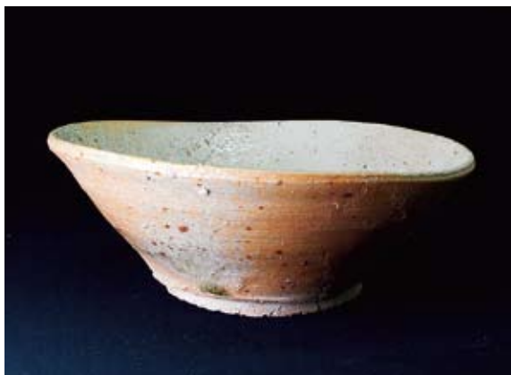
下石西山2号窯から出土した山茶碗（同館蔵）

山茶碗は平安時代後期から戦国時代初期ごろまでの約400年間に、東海地方で生産された茶碗と小皿などの素朴な無釉の陶器です。古窯跡の盗掘が盛んに行われた昭和時代初期ごろ、窯跡を求めて山へ入った人たちによって無釉の茶碗が大量に散乱している様子が度々発見されたことから、“山”茶碗と呼ばれるようになりました。主に食器や調理器具として、身分を問わず誰もが気軽に使うことのできた日常雑器だったといえます。本展では、美濃窯を中心に猿投・瀬戸・常滑・美濃須衛・恵那・中津川といった生産地の山茶碗やつぼ、鉢類、その他の希少な器種を展示し、山茶碗の歴史とその素朴な魅力を紹介します。