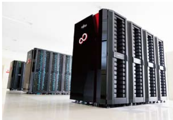
核融合科学研究所のスーパーコンピュータ 「プラズマシミュレータ」

プラズマシミュレータは2,592台もの強力なノードと高速通信のおかげで、1秒間に最大で2,620兆回もの計算ができます。これは市販のパソコンのほぼ10万倍に相当する速さです。言い換えると、パソコン10万台分の計算をスーパーコンピュータ1台で行えるということです。このような強力なスーパーコンピュータで、高温のプラズマがどのように運動するか日々計算が進んでいます。毎年秋に開催している同研究所のオープンキャンパスでは、スーパーコンピュータを間近で見られる企画を用意しています。ぜひお越しください。