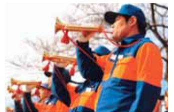
消防長賞「開始の合図」