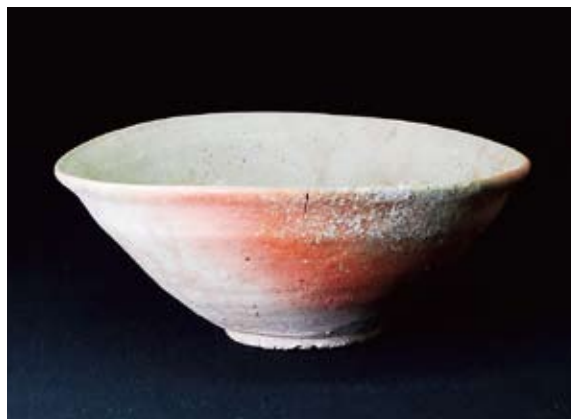
長湫1・2号窯から出土した山茶碗（同館蔵）