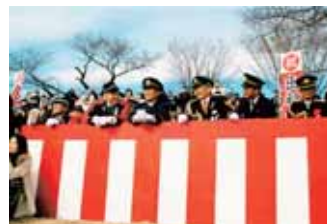
市消防協会長賞「満面の笑み」