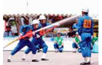
市議会議長賞「放水よし!」