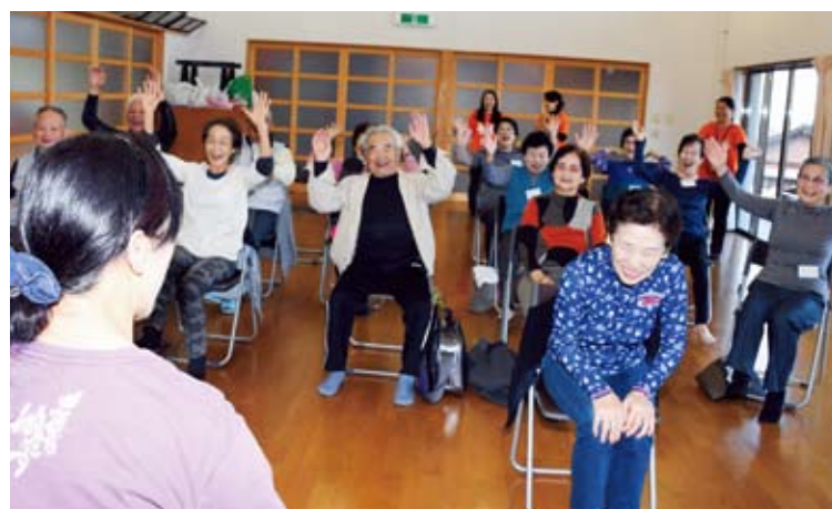
会場を沸かす講師(上)と教室を楽しむ参加者ら(雨池地区)

細野地区。参加者からは「大笑いをして、心も体も健康になれた」「足腰や背筋が伸び、自宅でも運動するようになった」「近所だから参加できた」「これからも参加したい」など評判は上々でした。 皆さんと一緒に、この取り組みを市内全域に広めていきたいと考えています。皆さんの地域でもぜひ開催してみてください。