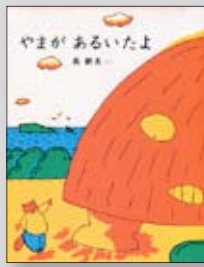
やまがあるいたよ 長新太／作