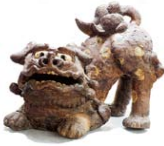
鉄釉狛犬 1797(寛政9)年 刻銘 妻山半宗