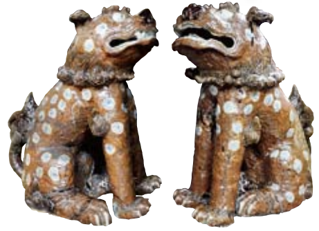
鉄釉狛犬(白山神社蔵) 土岐市指定文化財 1801(享和元)年 刻銘 山本□衛宗和 ※□は判読不明