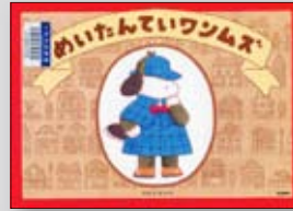
めいたんていワンムズ のはな はるか／作

冥界からの電話 ----- 佐藤愛子 図説明智光秀 ----- 柴裕之 ラッピングアイデアブック ----- オギハラ ナミ がん遺伝子治療のことがわかる本 ----- 石田幸弘