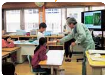
みんなで米ぬかの感触を確かめました。