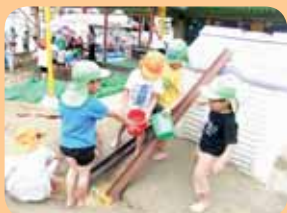
桶をつなげて水遊び

いろいろなことに興味・関心を持って、最後まで諦めずに取り組める力を育てています。