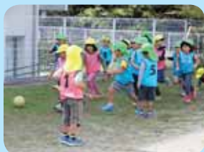
サッカー教室で体力づくり

あいさつや早寝・早起きをする、ごはんをしっかり食べるなどの生活習慣を身に付け、たくましい心と体を育てています。