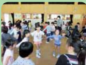
輪になってリトミック教室