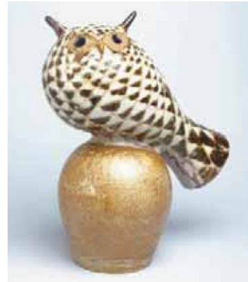
ミハエル・シルキン《彫像(鳥)》1950年代 アラビア製陶所 コレクション・カッコネン ©KUVASTO, Helsinki & JASPAR, Tokyo, 2018 C2428

19世紀末、ロシアからの 独立の気運が高まる中 で誕生した独創的なフィン ランドの陶磁器は、20 世紀中期には世界的な 潮流を生み出すまでに 成長しました。本展では、 19世紀末の黎明期から 最盛期の1950、60年代 までの作品をとおして、 フィンランド陶芸の魅力 を紹介します。