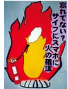
高島優里さんの作品