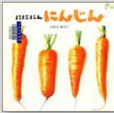
にににんにんじん いわさゆうこ／作