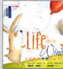
いのちはかぜのように バイリンガル絵本 ショーナ・イネス／作