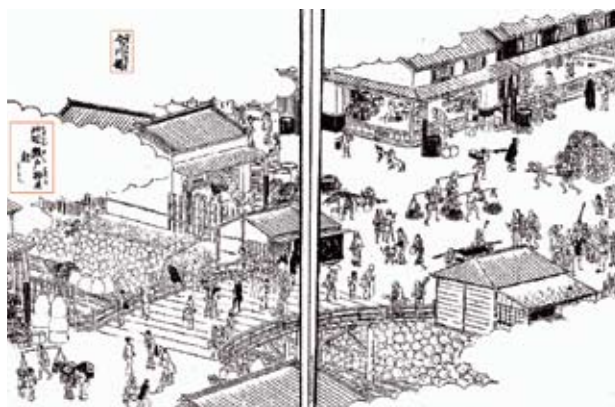
江戸名所図会 江戸時代後期

出荷された焼物は、現在の千代田区鍛冶町1丁目と中央区日本橋室町4丁目を結んだ位置にあった今川橋付近に多く集まっていた瀬戸物問屋で売られていました。その様子は、江戸時代後期に描かれた江戸名所図会から推察できます。