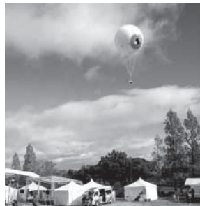
Nadegata Instant Party