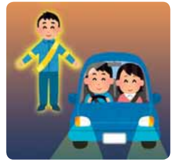
問 環境課 (内線253)