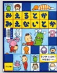
みえるとかみえないとか ヨシタケシンスケノ作

日本思想史の名著30 ----- 荻部直 これならわかるイギリスの歴史Q&A ----- 石出法太、石出みどり グアテマラを知るための67章 ----- 桜井三枝子 人の名前が出てこなくなったときに読む本 -- 松原英多