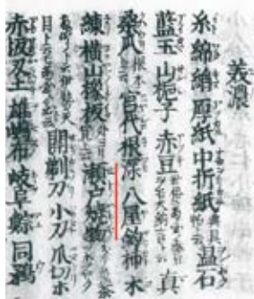
毛吹草(写本)：パネル展示

美濃で生産された焼物が「美濃焼」として販売されるようになったのは江戸時代後期以降で、一般に認識されるようになったのは明治時代に入ってからでした。そのため、現在でも瀬戸焼や唐津焼など他の産地の焼物と比べると、「美濃焼」の知名度が低いのではないかと考えられます。