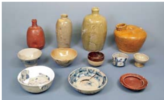
江戸時代後期から幕末にかけて美濃窯で生産された焼物 (多治見市教育委員会蔵)