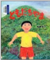
ともだちやま 加藤休ミノ作