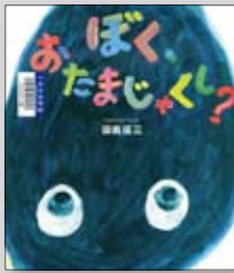
ぼくおたまじゃくし? 田島征三／作