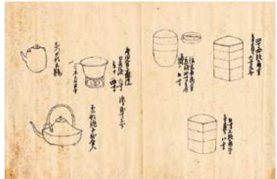
御薬園注文書図面 1852(嘉永5)年 妻木公民館郷土資料室蔵