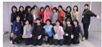
H29年度の参加者の皆さん