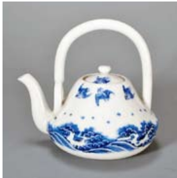
染付波千鳥文富士形銚子 妻木公民館郷土資料室蔵

御薬園から妻木氏へは、陶磁器の種類や数が記された注文書が出され、それぞれの寸法や形状を詳細に記した図面が添えられていました。現在、妻木町には御薬園の御用焼として製造されたと思われる染付磁器が残されています。注文書図面と同じ形状をした「不二（富士）形銚子」です。名称は富士山のような形状から来ていると考えられ、側面に波と千鳥が描かれた美しい銚子です。