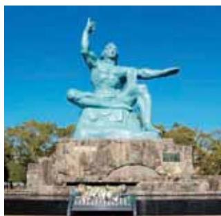
長崎市 平和記念像