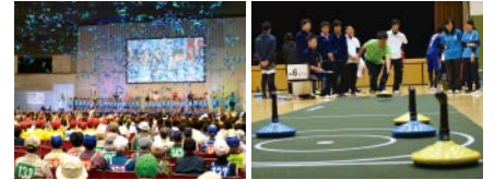
「ぎふ清流レクリエーションフェスティバル2017」の様子 (左:総合開会式、右:ユニカール)

子どもや高齢者、障がいのある方もない方も、県民すべてがレクリエーションに触れることができる「ぎふ清流レクリエーションフェスティバル」を開催します。