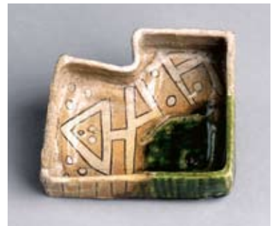
鳴海織部向付 元屋敷窯 江戸時代初頭 重要文化財