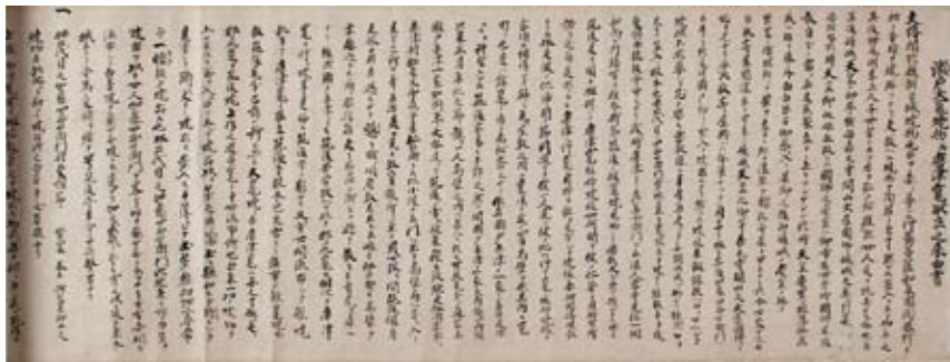
「瀬戸大窯焼物並唐津窯取立之来由書」 元屋敷開窯の経緯や陶工の戦いの様子が記される由緒書 貞享3年(1686) 土岐市指定文化財