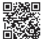
国道19号ライブカメラ状況 (多治見砂防国道事務所HP)