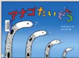
アナゴたいそう 作/うさやまみやこ 絵/みうらあや