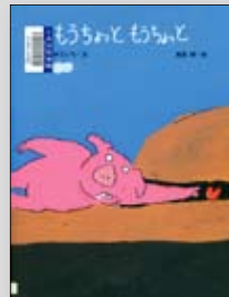
もうちょっともうちょっと 文/きむらゆういち 絵/高畠純

極夜行 ----- 角幡唯介 ベーシックインカムへの道 -- ガイ・スタンディング やわらかせなか ----- 山本たか子 全196カ国おうちで作れる世界のレシピ --- 本山尚義 ぐうたら流有機農業のコツ読本 ----- 西村和雄