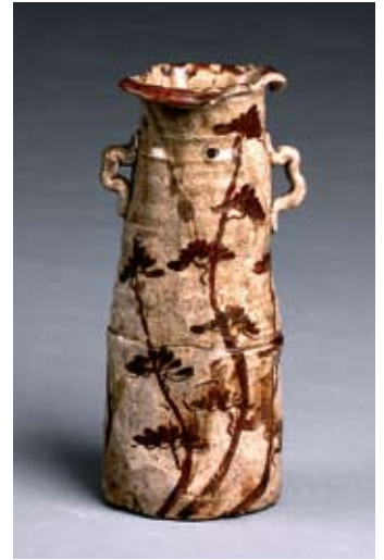
美濃唐津花入 元屋敷窯(江戸時代初頭)