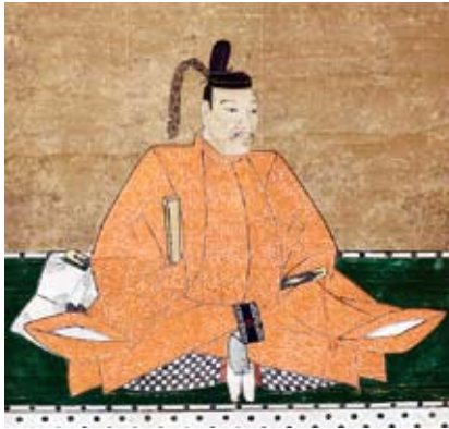
二代妻木頼忠(家頼)肖像 崇禅寺蔵 頼忠の妹が唐津藩に嫁ぎました

元屋敷窯では、唐津から最新式の窯を導入しつつ、製品の窯詰や成形、釉薬などはそれまで美濃窯で培ってきた技術を集大成し、「織部」が量産されました。一方、先月ご紹介した妻木氏御殿の脇に築かれた「御殿窯」は、窯の詳細な構造は明らかになっていませんが、製品の窯詰方法にまで唐津の技術を用いた、唐津とのつながりをより濃く感じさせる窯でした。