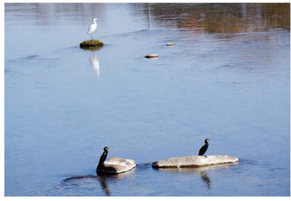
「黒と白、赤のコントラスト」

土岐川沿いをウォーキング中、南の方角を見ている鳥たちを見掛けました。視線のその先には、赤く色付いた山や木々が。鳥たちの儀式があったのかも。