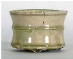
青磁香炉(左)と灰釉香炉(右) 中国製(左)と瀬戸美濃窯産の模倣品(右) 一乗谷朝倉氏遺跡出土 福井県立一乗谷朝倉氏遺跡資料館蔵