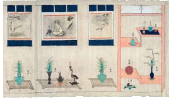
『立花伝書』 室町時代 福井県立一乗谷朝倉氏遺跡資料館蔵

美濃窯では室町時代（16世紀）に唐物の模倣品としての茶陶の生産が始まり、土や釉薬は異なるものの、唐物とよく似た製品が作られました。