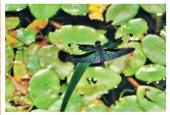
ちょうとんぼ 「蝶蜻蛉」

梅雨晴れ間の7月半ばに陶史の森へ出掛けました。ジュンサイの池で今年も蝶蜻蛉に出会うことができました。陽の光を受けて青紫色の光沢が一段と美しく見えました。豊かな自然が残っていることに感謝したいです。