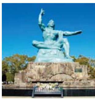
長崎市 平和記念像

問 秘書課（内線203） 日時 ▽8月6日(日) 午前8時15分 ▽8月9日(水) 午前11時2分 ▽8月15日(火) 正午 また、終戦記念日の8月15日にも、黙とうを行います。皆さんのご協力をお願いします。