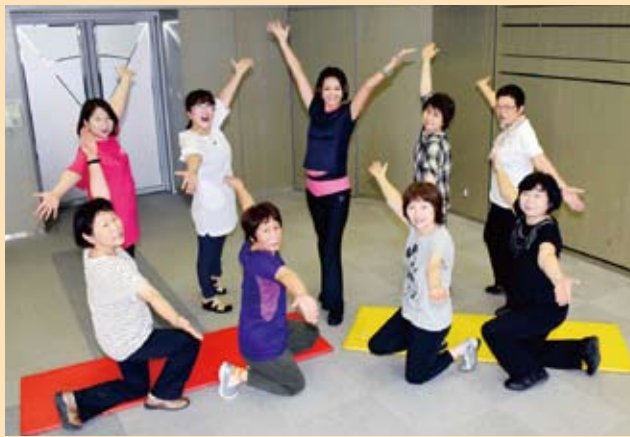
すっきりスリム教室に参加した皆さん