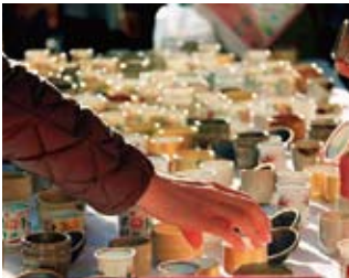
▲地酒と美濃焼のイメージ写真

地元の酒蔵と美濃焼メーカーがコラボした酒イベントを9月16日(土)～18日(月・祝)に多治見