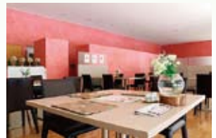
▲和食と美濃焼の会場風景

「ミシュラン」一つ星獲得の料理人監修の元、施設内のレストランにて岐阜県の食材を使った和食を、地元の有名な窯元で作った美濃焼で提供します。なお、事前予約制です。