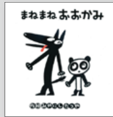
まねまねおおかみ みやにし たつや

効きすぎて中毒になる最強の心理学 ----- 神岡真司 地形で読み解く古代史 ----- 関裕二 働けるうちは働きたい人のためのキャリアの教科書 ----- 木村勝 面白くて眠れなくなる元素 ----- 左巻健男