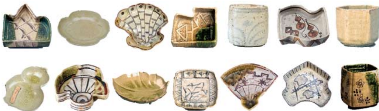
型づくりの茶陶（美濃桃山陶と御深井釉陶器） ※重要文化財、岐阜県立多治見工業高等学校蔵を含む

やがて、織部の生産が衰退して御深井釉陶器の生産が始まると、中国の青磁の意匠を取り入れた上品な表現へと変化します。そうした中でも型づくりの技術は受け継がれ、葉をかたどった器には葉脈を繊細に浮かび上げらせ、より本物に近づけた表現が際立ちます。