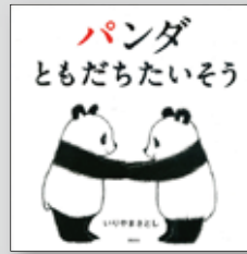
パンダともだちたいそう いりやまさとし

インドの小学校で教えるプログラミングの授業 -- 織田直幸 すぐ試したくなる! 実戦心理学大全 -- おもしろ心理学会 またたび ----- 菊池亜希子 世界のへんな肉 ----- 白石あづさ