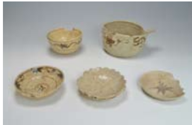
定林寺西洞2・3号窯出土品 (17世紀前期)