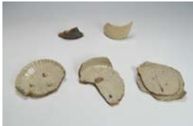
定林寺西洞1号窯出土品 (16世紀末～17世紀初頭)

5月28日(日)まで開催 第1展示室では、重要文化財公開「元屋敷陶器窯跡出土品展」を開催中です。