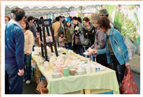
「どえらあええよ」 10月最後の土曜日。ふらっと立ち寄った「どえらあええ祭り」。活気があって「どえらあええ」ですね。 【撮影場所】 下石町

皆さんのお気に入りの写真を募集します ■テーマ 風景・イベント（被写体本人などの承諾を得てください）など最近1年以内に市内で撮影した写真