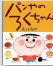
「パンヤのろくちゃん」 長谷川義史

ほんほん本の旅あるき ----- 南陀楼綾繁 運命を切り開く因果の法則 ----- 伊藤健太郎 現代家系論 ----- 本田靖春 断片的なものの社会学 ----- 岸政彦