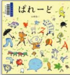
「ぱれーど」 山村浩二