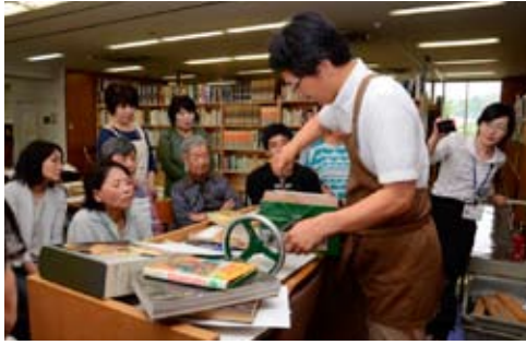
5月の図書修理講座(初級)の様子