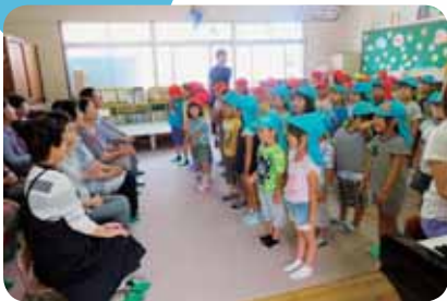
幼稚園の歌(園歌)や季節の歌を歌うと「うまく歌えたね」と褒めていただきました。