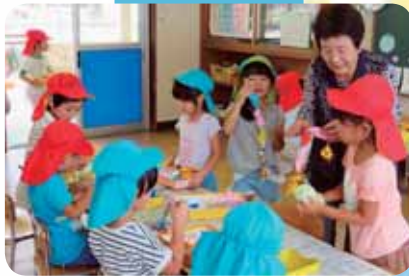
違う色の貝をつないで「長くしようね」と言いながら一緒に作っていただきました。