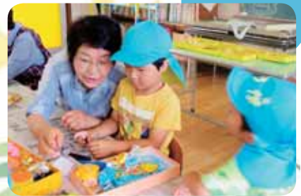
細かな作業も、やさしく丁寧に教えていただきました。