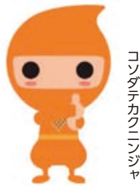
コンダテカクニンジャ

現況届の裏面が子育て世帯臨時特例給付金の申請書になっています。申請期限の9月15日（火）を過ぎると受け付けできませんのでご注意ください。