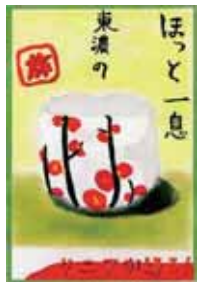
H26 子どもの部 最優秀賞