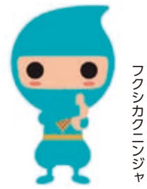
フクシカクニンジャ

対象になると思われる方には、8月下旬に申請書を送付します。必要事項を記入の上、期間内に申請してください。支給要件を満たすと思われる方で申請書が届かない場合は、問い合わせください。