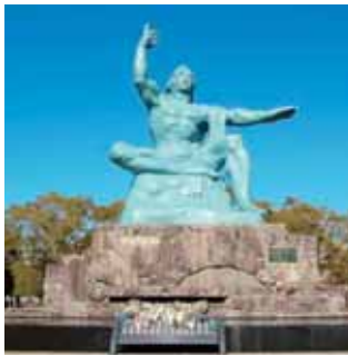
長崎市 平和祈念像

問 秘書広報課(内線206) ▽8月6日(木)午前8時15分 ▼8月9日(日)午前11時2分 ▼8月15日(土)正午 日時 また、終戦記念日の8月15日にも、黙とうを行います。皆さんのご協力をお願いします。 広島市と長崎市では、原爆が投下された日から70年目を迎える8月6日と9日に、原爆による死没者の慰霊式と平和祈念式を行い、原爆投下時刻に1分間の黙とうを捧げます。土岐市でも、次の日時に防災行政無線で黙とうを呼びかけます。