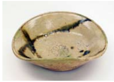
灰釉緑釉流し大鉢