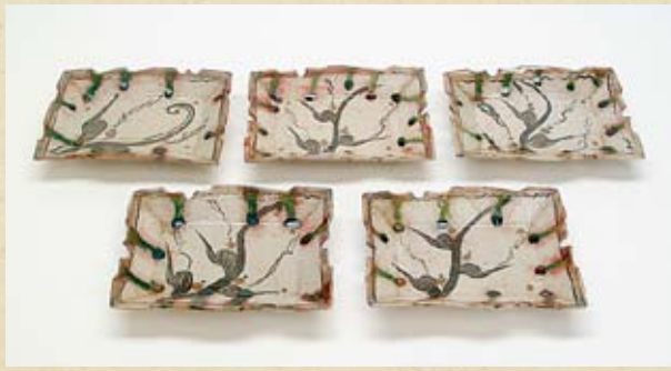
弥七田織部向付 (17世紀前期)