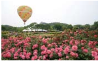
世界のバラ園と気球

世界最大級のバラ園を有する花フェスタ記念公園では、「花で育む 清流の国ぎふ」をテーマに、春のバラの時期に合わせて、「花フェスタ2015ぎふ」を開催します。「美しく、美味しい祭典」をお楽しみください。