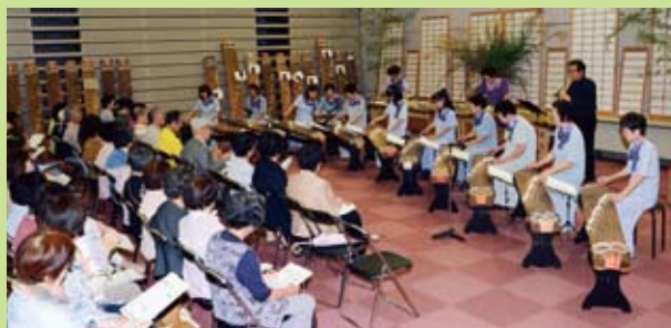
▲昨年9月のコンサートの様子

日時 5月9日(土)午後2時開演 場所 下石公民館 出演 多治見西高等学校・中学校箏曲部、寿会 入場料 無料(申込不要) 問 下石公民館(☎65727)