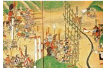
長篠合戦図屏風 (副本・犬山城白帝文庫蔵)

国宝・重要文化財をはじめとする第一級の資料群から、織田信長、豊臣秀吉、徳川家康、三人の「天下人」の実像を探り、織豊政権の形成に岐阜の地が果たした役割を明らかにします。