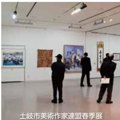
土岐市美術作家連盟春季展

また、この日のセラトピア土岐では、協賛事業の土岐市美術作家連盟春季展も開催されるなど、多くの来場者が、心と目の保養をしました。