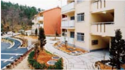
申・問 都市計画課 (内線316)