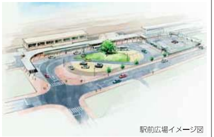
駅前広場イメージ図