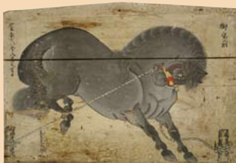
絵馬一对(県指定文化財)