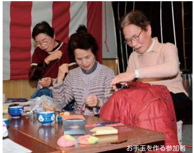
お手玉を作る参加者