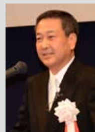
土岐市長 加藤靖也

本日ここにお集まりの皆さまにおかれましては、その豊かな識見と貴重な体験を十分に生かして、本市発展のためさらなるご尽力をいただきますようお願いいたします。