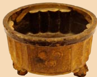
香炉(市指定文化財)

期 日 2月28日(土)～3月15日(日) ※3月2日(月)・9日(月)は休み 時 間 午前10時～午後4時 場 所 妻木公民館