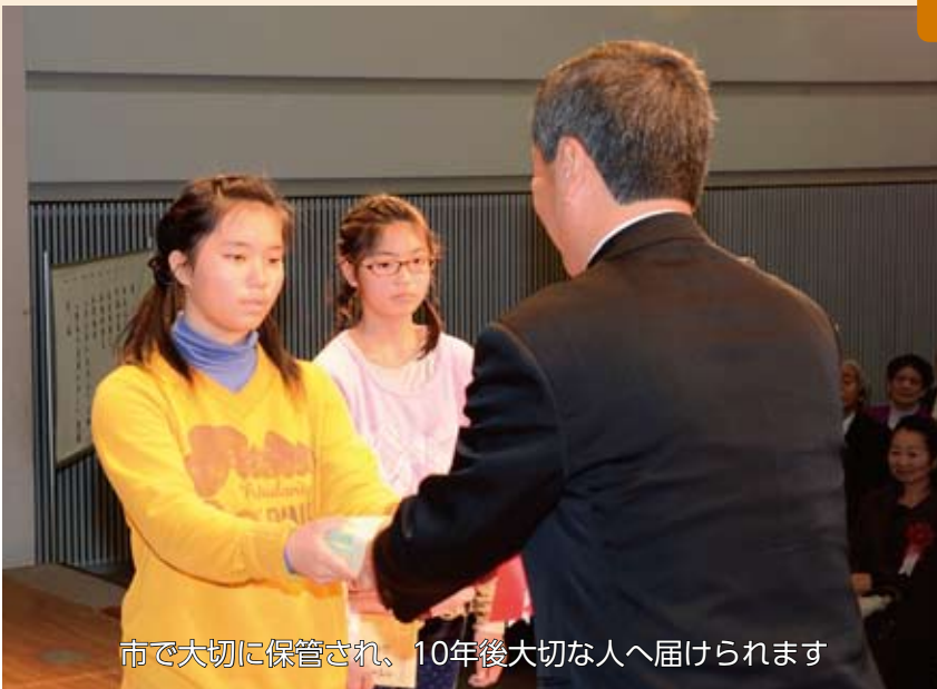
市で大切に保管され、10年後大切な人へ届けられます

2月1日(日)に、土岐市功労者表彰式が行われました。式典の後半で、土岐市の60年の歩みを振り返る記念映像が上映されたほか、鶴里小学校と曾木小学校の全児童が取り組んだ、10年後の大切な人へ手紙を送る「未来レター」が、代表児童から市長へ手渡されました。