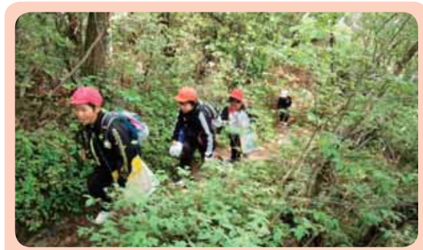
城山山頂をめざす子どもたち