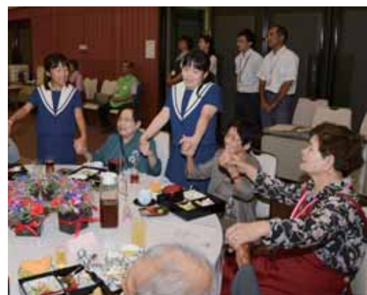
昨年度の敬老会の様子

対象 大正13年4月2日～大正14年4月1日生まれで、平成26年8月1日現在土岐市に住民票のある方 日時 9月6日(土) 午前11時30分～午後1時（予定） 場所 セラトピア土岐2階・小ホール