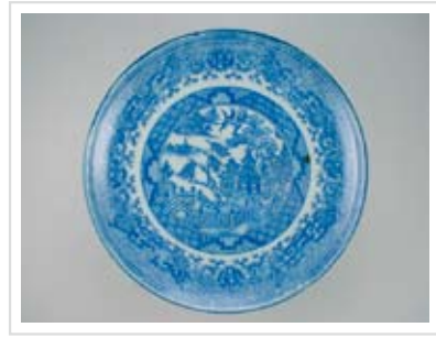
銅版ウィロー図皿 (表面)