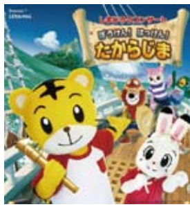
しまじろう