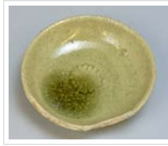
印花が施された灰釉丸皿 (柿野1号窯)

淡緑色を呈する釉薬が施された「灰釉皿」は、天目茶碗、すり鉢と共に16世紀に量産された製品です。釉薬を全面に施し、器面に印花や櫛描で文様を表すなど、中国の染付や青磁を模倣しています。このように高台を含めた器の全面に施釉された製品は高級陶器としての性格を持っており、中国陶磁の代替品であったと考えられます。