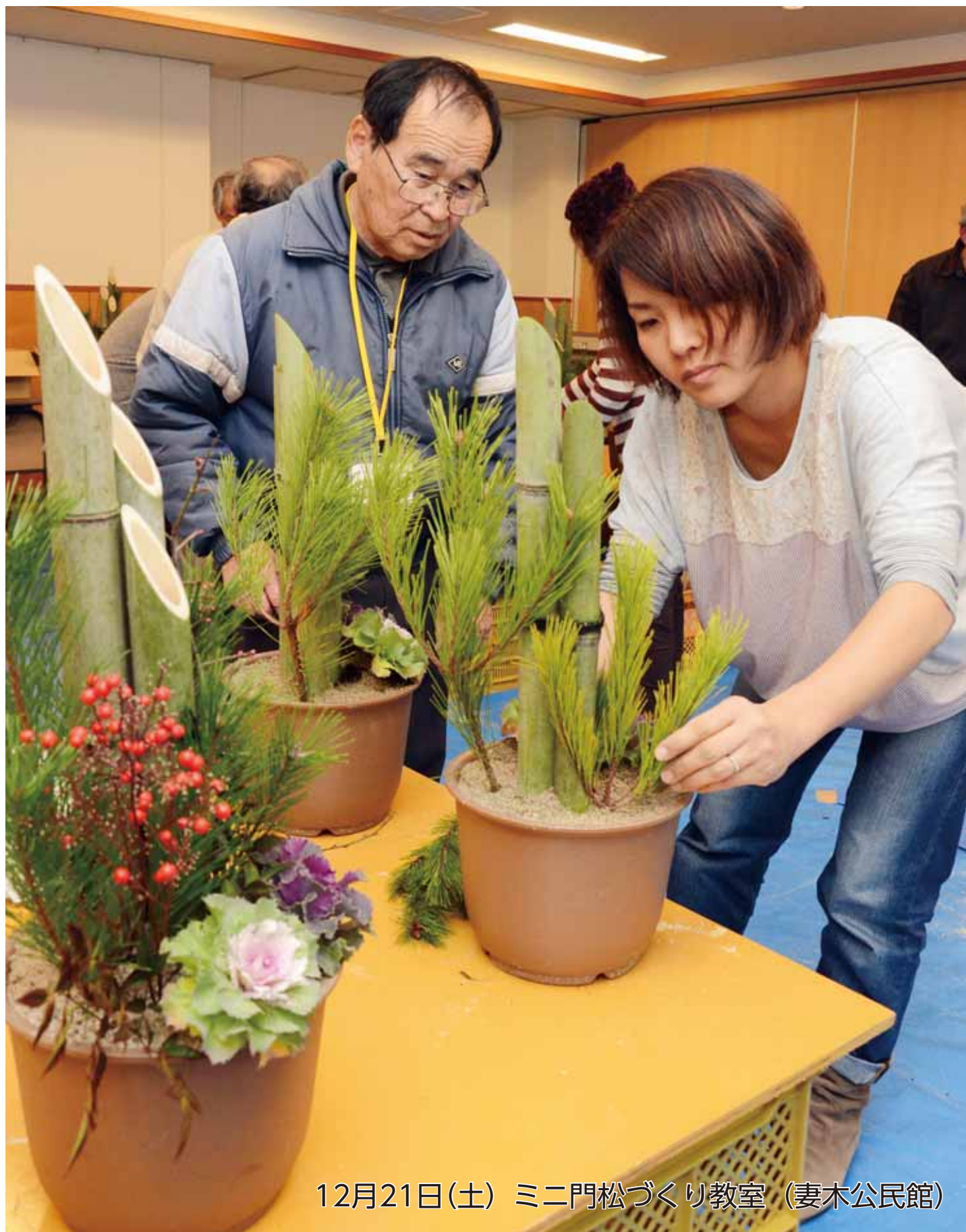
12月21日(土) ミニ門松づくり教室 (妻木公民館)