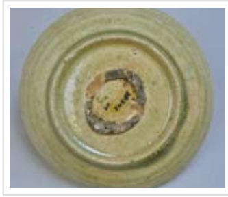
同右の底部 高台まで施釉されている