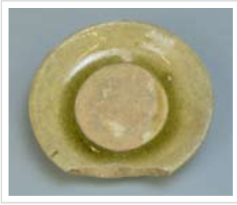
灰釉内禿皿 (定林寺東洞1号窯)