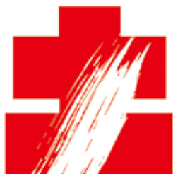
国際陶磁器フェスティバル ロゴ