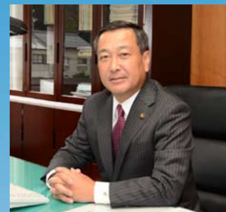
土岐市長 加藤靖也