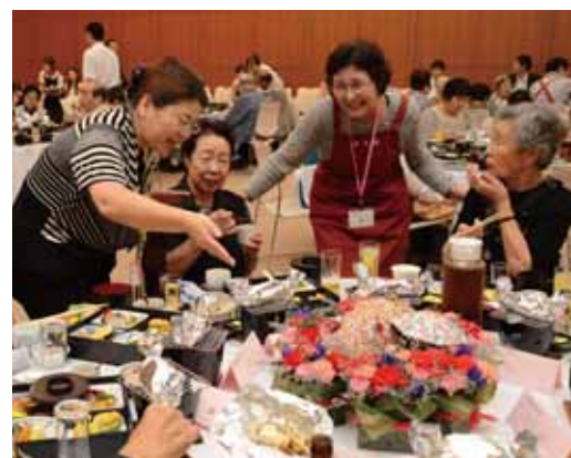
昨年度の敬老会の様子

対象 大正12年4月2日～大正13年4月1日生まれで、平成25年8月1日現在土岐市に住民票のある方 日時 9月21日(土) 午前11時30分～午後1時（予定） 場所 セラトピア土岐2階・小ホール