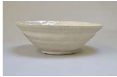
山茶碗 碗(丸石3号窯出土)