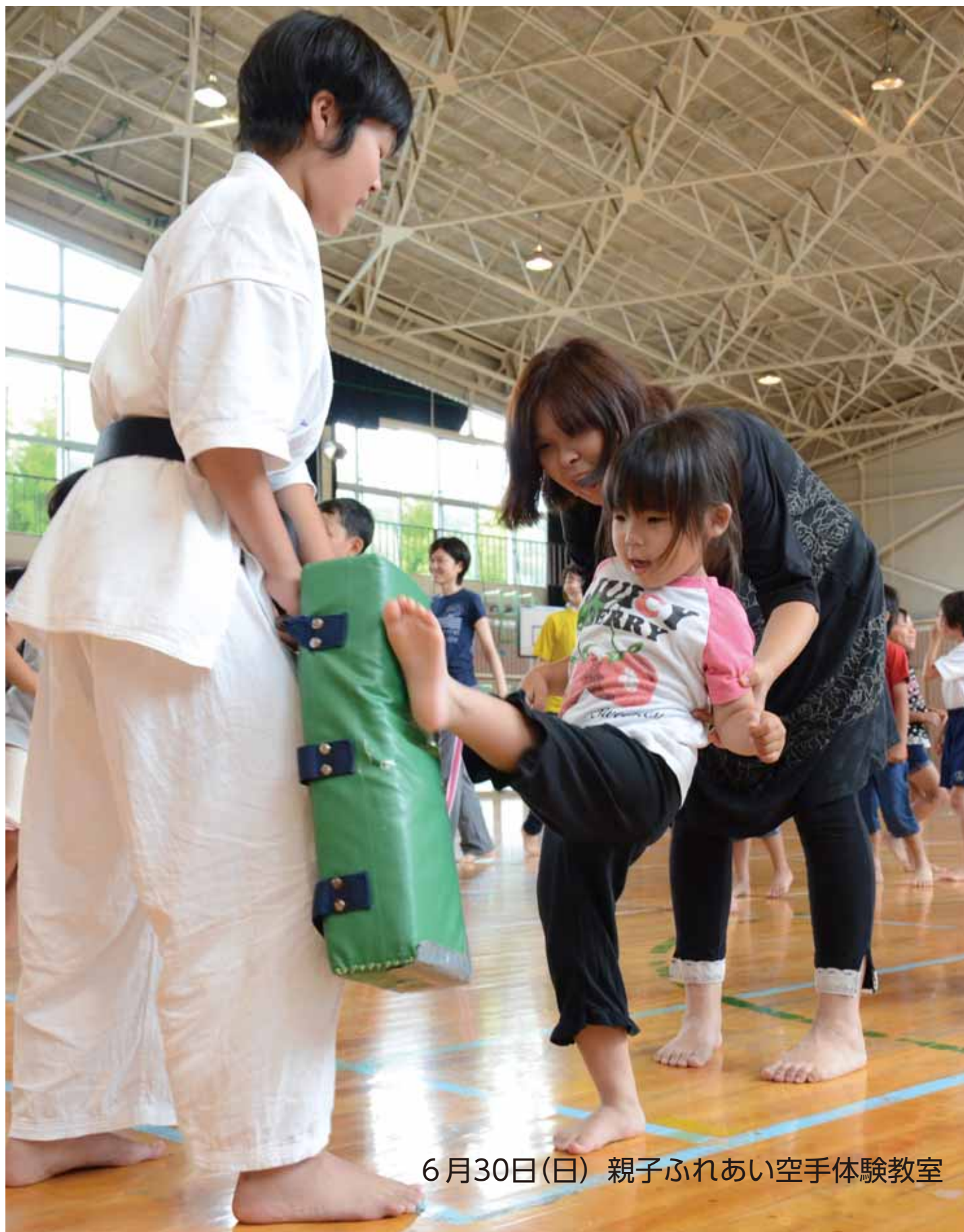
6月30日(日) 親子ふれあい空手体験教室