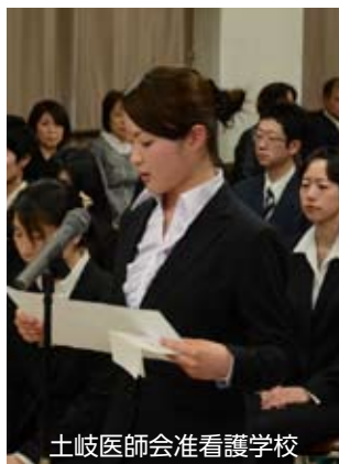
土岐医師会准看護学校