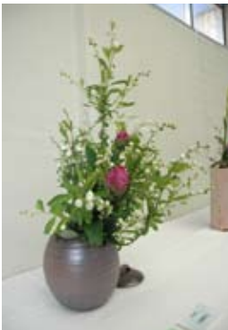
花と器展 @美濃陶磁歴史館