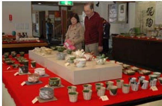
美濃焼伝統工芸品即売会@美濃焼伝統産業会館