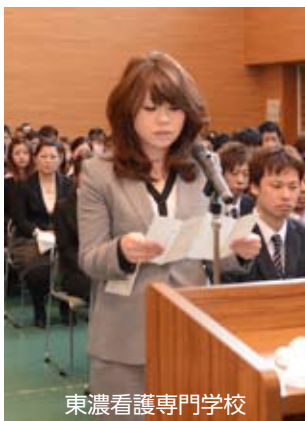
東濃看護専門学校