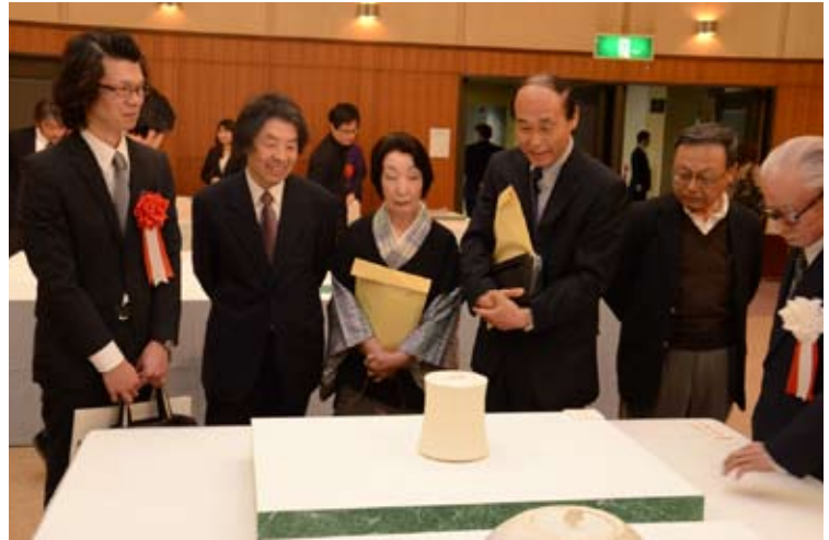
現代茶陶展@セラトピア土岐 展覧会の様子 (TOKI織部大賞受賞作品：碧の器)

セラトピア土岐では、13日に第6回現代茶陶展の授賞式と展覧会が行われました。この展覧会は、茶陶(茶道に使う陶器の道具)を全国から公募するもので、先人が磨き上げてきた茶陶に現代の作家がさまざまな技法や意匠を凝らし、「新たな茶陶」を生み出すことを目指して開催されるものです。今回の受賞作品は、本紙4月1日号で紹介しています。