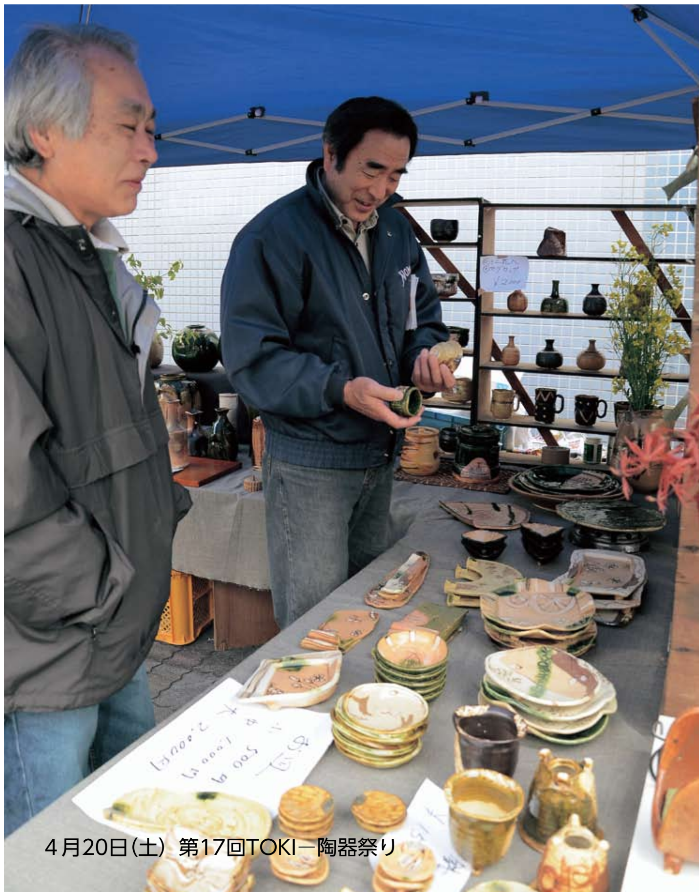
4月20日(土) 第17回TOKI-陶器祭り