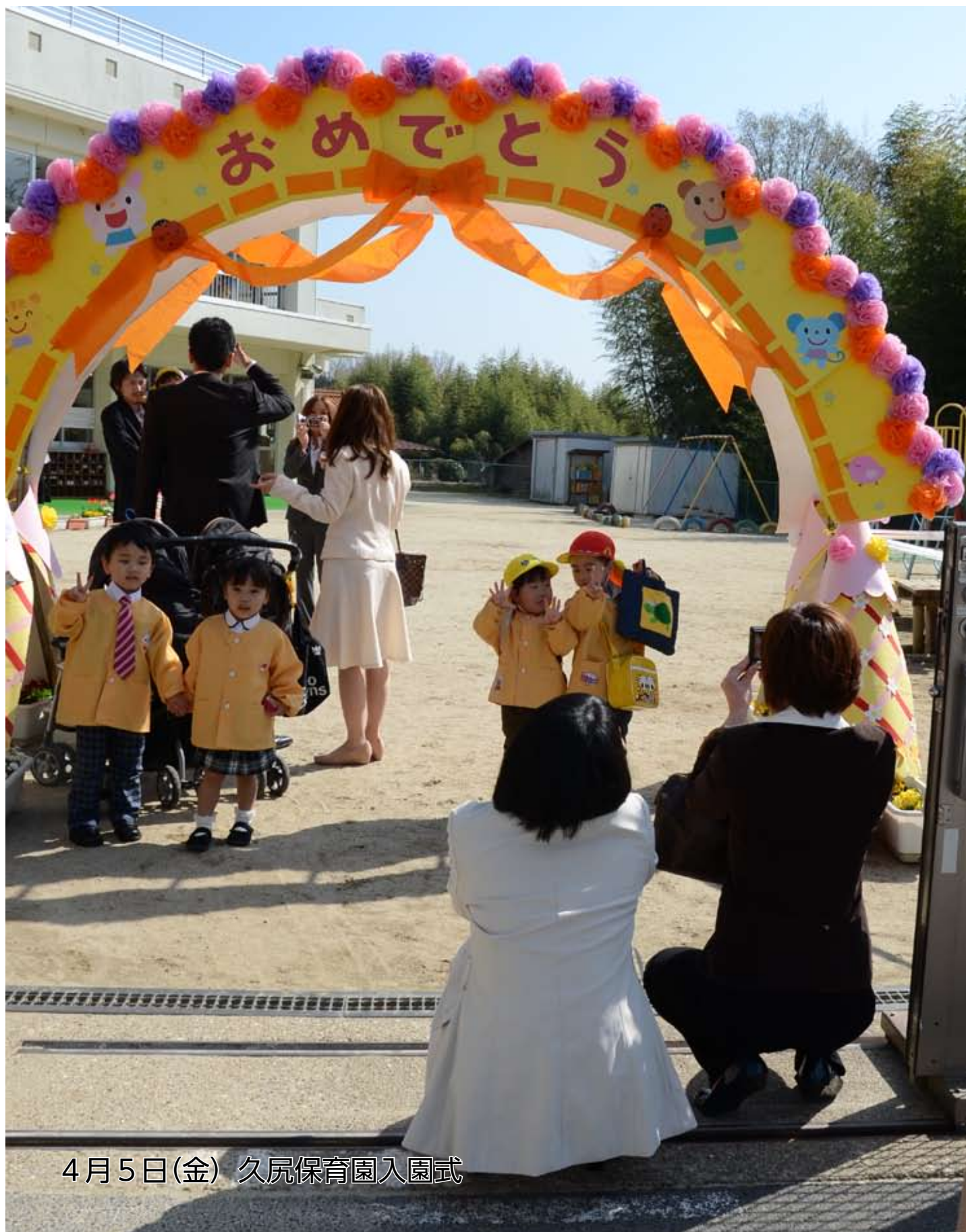
4月5日(金) 久尻保育園入園式