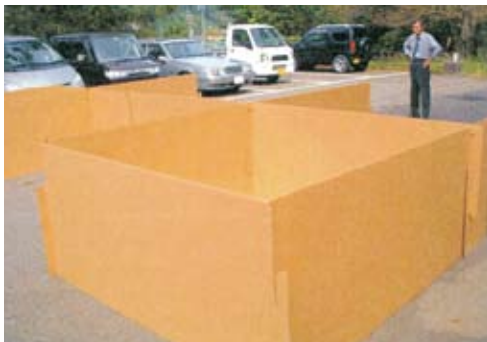
段ボール製の間仕切り

地域の防災訓練などで避難後の生活について話し合ったことはありますか。プライバシーの問題も含め、避難所での環境づくりやルールについて話し合い、事前に準備をしておきましょう。