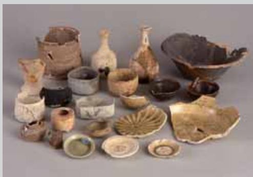
元屋敷東2号窯跡出土遺物