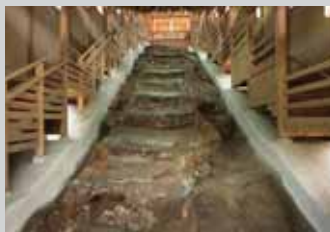
元屋敷窯跡 (連房式登窯)