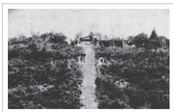
昭和10年頃の三国山

「三二四国八十八カ所」が最初に三国山につくられたのは昭和9年頃のこと。それから50年近くたち、木立に埋もれてしまった石像が地元の方により発掘され、四国八十八カ所が再現しました。高さ50センチ程の大師石像88体が三国山案内板から頂上の展望台まで、およそ100メートルの道端に並べられ、三国山の“新名物”に加えられました。