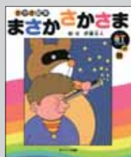
「まさかさかさま 虹の巻」 伊藤文人