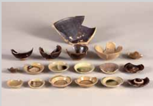
元屋敷東1号窯跡出土遺物