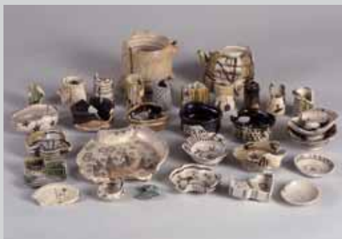
元屋敷窯跡出土遺物

2月27日の文化審議会文化財分科会において、土岐市が所有する「岐阜県元屋敷陶器窯跡出土品」が国の重要文化財に指定されました。今回は、新たに重要文化財に指定された元屋敷陶器窯跡出土品について紹介します。