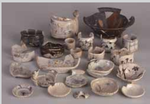
元屋敷東3号窯跡出土遺物