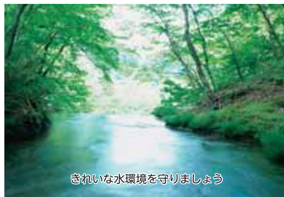
きれいな水環境を守りましょう

単独処理浄化槽をお使いの方は、お風呂、トイレ、台所などの水廻りのリフォームなどの際には、生活雑排水の浄化処理もご検討ください。