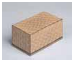
神代杉木画箱(長谷川英二作)

会期 9月27日(木)～12月9日(日) 休館日 10月8日を除く月曜日、10月9日(火) 会場 美濃陶磁歴史館 観覧料 ▷一般=200円 ▷大学生=100円 ▷高校生以下=無料