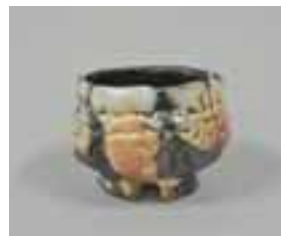
利休 ねずみ 志野割高台茶碗