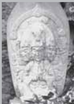
〈中〉岩肌を削って納められています。 〈下〉中央の馬頭観音は、高さが1m程ある大きなものです。

頭観音は、三つの顔と六本の腕を持つ姿で表され、背面には「曾木村馬主連中大正十三年」と明瞭に刻まれており、曾木村の人々が馬の安全を祈願して造立したことがうかがえます。