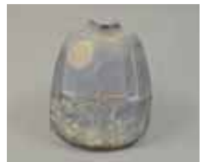
群青志野秋草紋扁壺

会期 9月28日(金)～11月4日(日) 休館日 10月8日を除く月曜日、10月9日(火)・10日(水) 会場 美濃焼伝統産業会館 入場料 無料