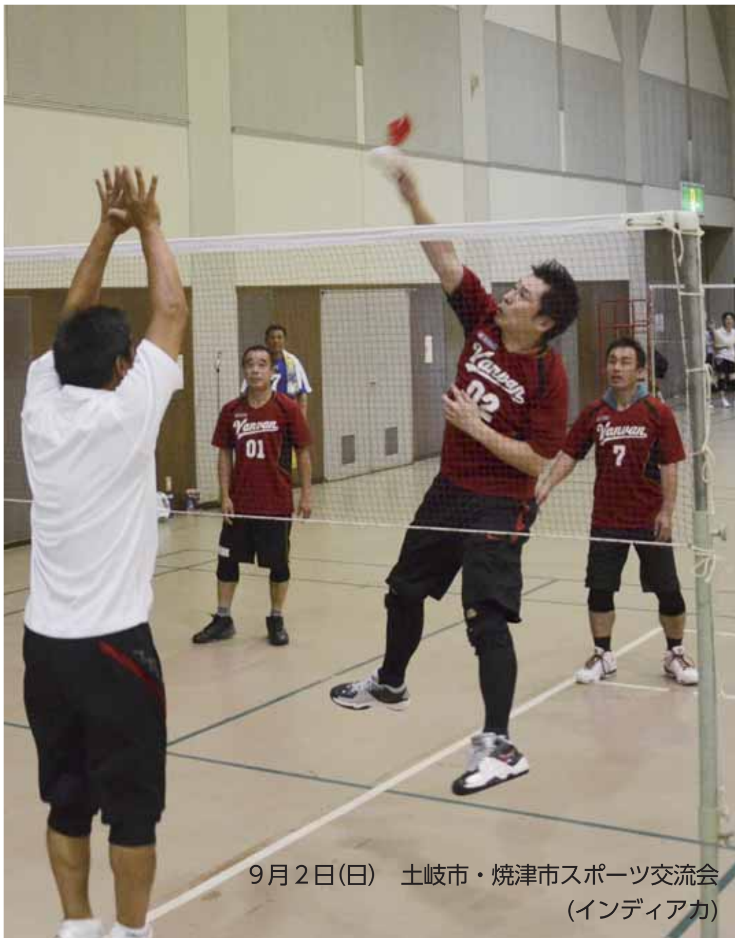
9月2日(日) 土岐市・焼津市スポーツ交流会 (インディアカ)