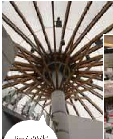
ドームの屋根から柔らかな自然光が(‘o’)

▷夏休みの課題で紹介されていて、子どもにリクエストされて来ました。幅広い年の方が楽しめる場所ですね。家族4人で「どんぶりソフト」を食べました。(中津川市)