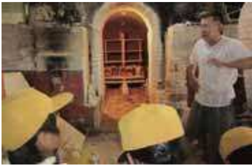
▲陶磁器工場の見学