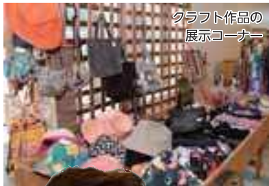
クラフト作品の展示コーナー