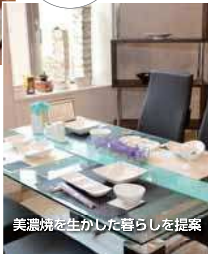
美濃焼を生かした暮らしを提案