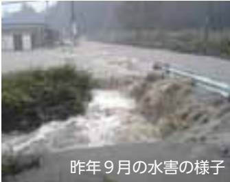
昨年9月の水害の様子