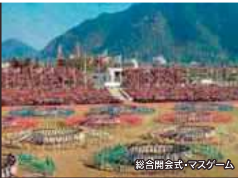
総合開会式・マスゲーム