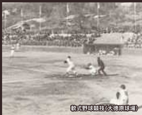
軟式野球競技(大徳原球場)