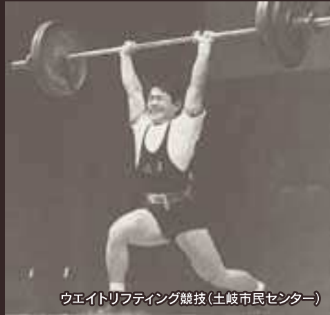
ウエイトリフティング競技(土岐市民センター)