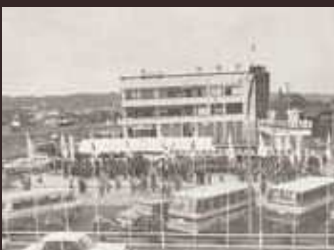
土岐市駅前の歓迎装飾