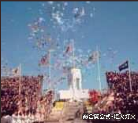
総合開会式・炬火灯火