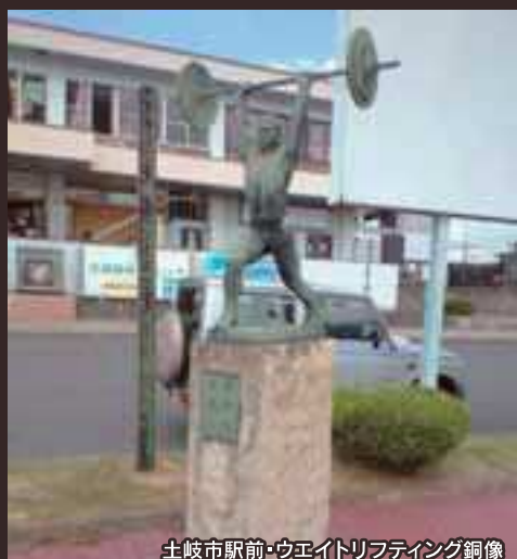
土岐市駅前・ウエイトリフティング銅像