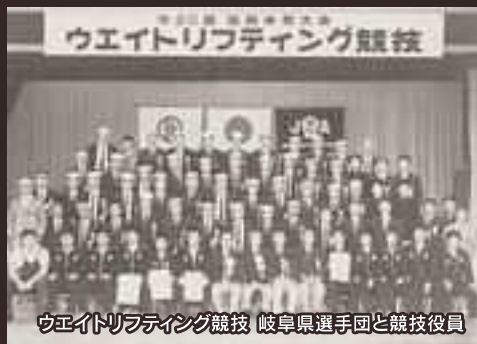
ウエイトリフティング競技 岐阜県選手団と競技役員