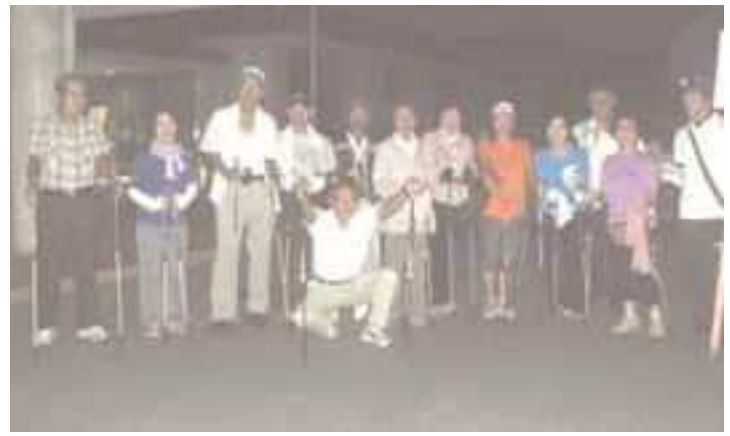
▲9月6日(火)肥田公民館で行われた ノルディックウォーキングの会の様子