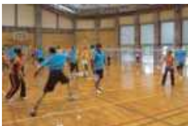
▲ファミリーバドミントンの様子

スポンジテニス、ソフトバレー、インディアカ、カローリング、ペタンク、ユニホック、ピロポロ、輪投げ